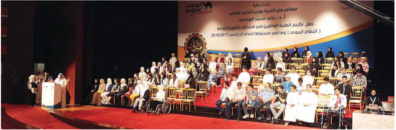
بروفة من حفل تكريم خريجي الثانوية